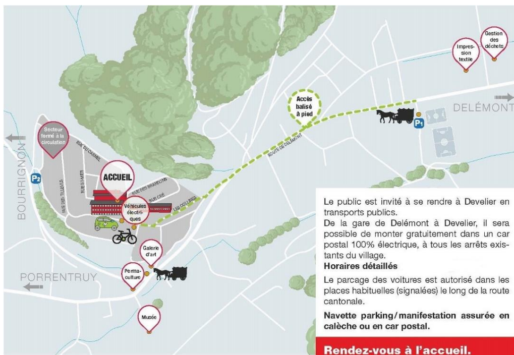
Carte des arrêts des cars postaux